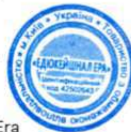
Ілля Філіпов Керівник студії онлайн-освіти EdEra