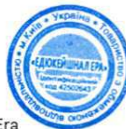
Ілля Філіпов Керівник студії онлайн-освіти EdEra