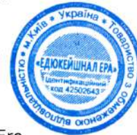
Ілля Філіпов Керівник студії онлайн-освіти EdEra